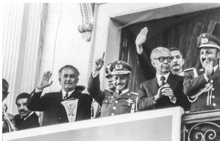
Imagen 1. Celebración en La Paz del triunfo del golpe del 21 de agosto de 1971. De izquierda a derecha: Mario Gutiérrez, Hugo Banzer y Víctor Paz Estenssoro 16 .

En la misma misiva, le advierte a Gutiérrez que “Por mucho que en Bolivia se sospecha algo del entendimiento, pienso que no debe hacerse público hasta el momento mismo de la acción para no poner en alerta al gobierno (...)”, agregando a continuación que prontamente un enviado suyo le informará “(...) ciertas tácticas que deben ponerse en práctica en la labor preparatoria y otras ya en el curso de la acción” 14 . Banzer, por su parte, envió el 6 de agosto una misiva a la FSB y al MNR, expresando “(...) mi sincero agradecimiento por el honor con que me han distinguido al ungirme como el líder del Movimiento Revolucionario que encauzamos (...)” 15 .